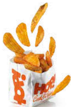
Spicchi di patate