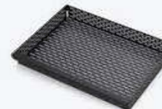
GP64 GRIGLIA TEFLONATA