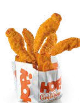
Pepite di pollo