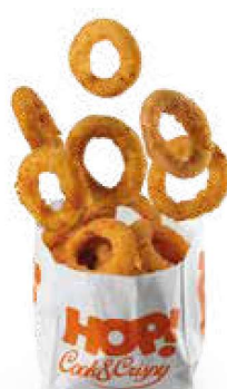
Anelli di cipolla