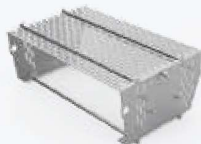
BK02 CESTELLO IN ACCIAIO INOX FISSO