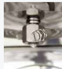
SISTEMA DI LAVAGGIO AUTOMATICO