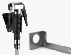
S1 DOCCIA LATERALE