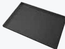
PT50 TEGLIA TEFLONATA