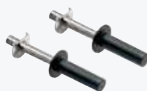
HD01 MANIGLIE PER ESTRAZIONE DEL CESTELLO