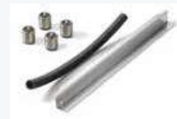
SK30 KIT DI SOVRAPPOSIZIONE