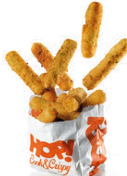
Stick di mozzarella