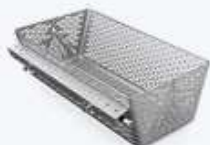
BK01 CESTELLO IN ACCIAIO INOX INTERNO