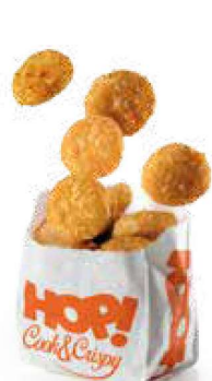
Palline di camembert